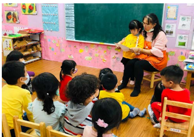
照片三：老師幫忙唸信