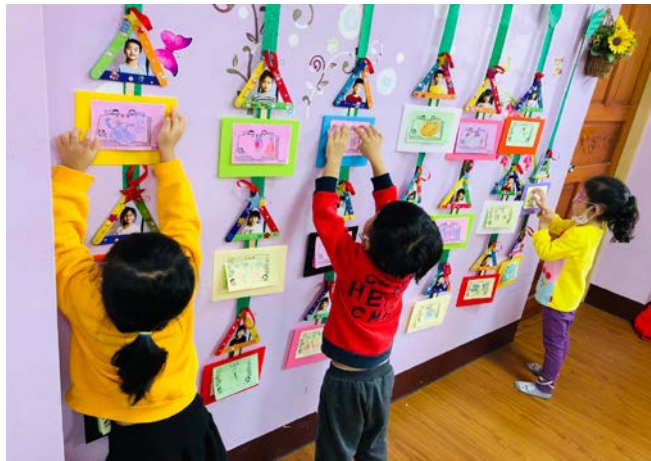
照片三：貼上我的讚美