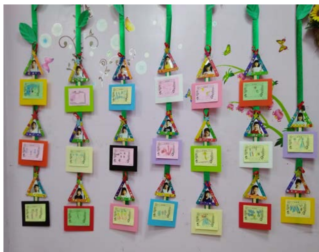
照片一：幸福便利貼牆