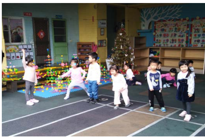
照片四：大家都是長~我是運動長