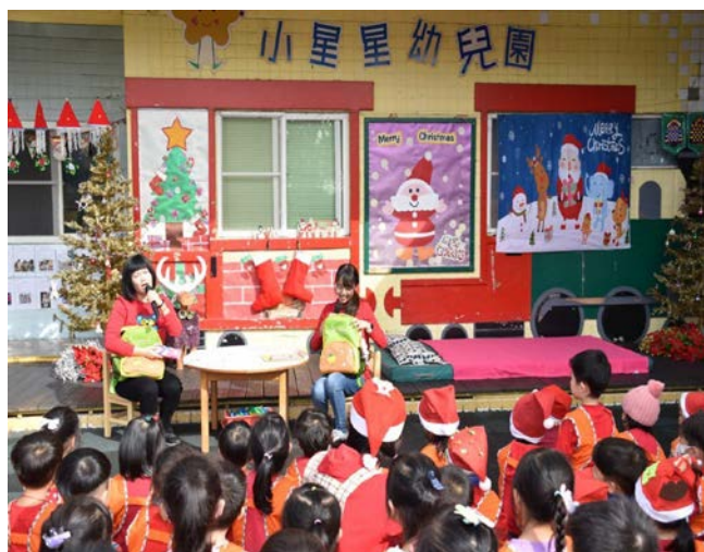
照片一：戲劇欣賞~空空的聖誕襪