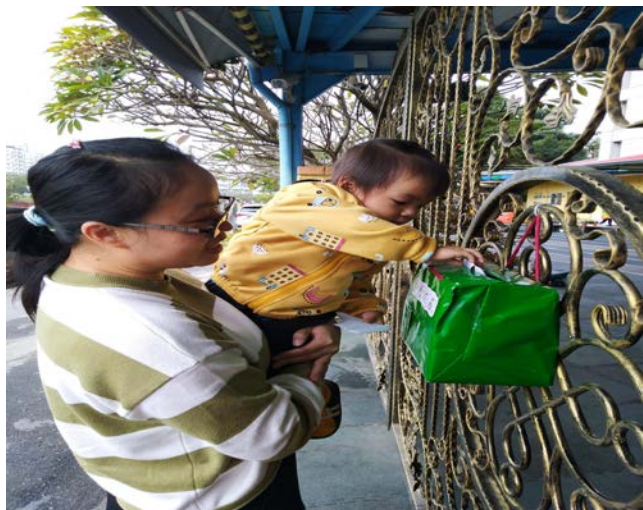
照片一：小小郵差來送信