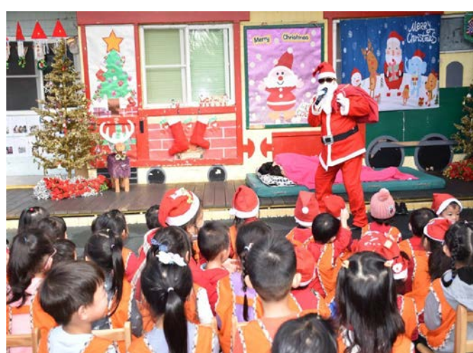
照片二：聖誕老人進城來