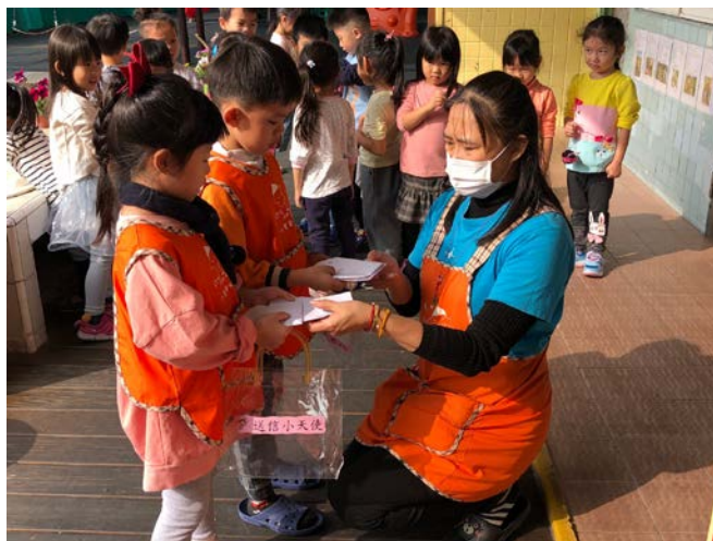
照片二：送信小天使