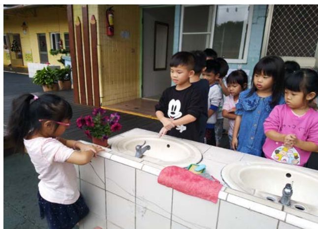
照片五：大家都是長~我是洗手長