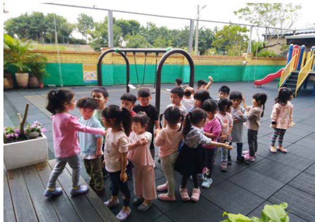
照片三：大家都是長~我是秩序長