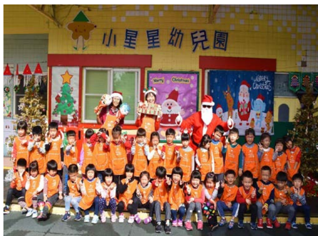
照片三：和聖誕老公公拍照